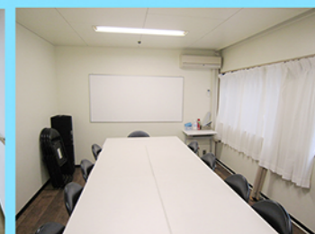
1階 第1教室・第2教室